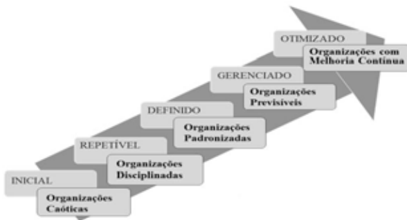
Figura 1: Os Cinco Níveis de Maturidade CMM.

O nível de maturidade é uma base bem definida que determina as características da empresa naquele nível. Cada nível é uma base para o seguinte. Conforme as empresas implementam os processos definidos para o nível de maturidade e progredem para outro nível tornam-se mais sistemáticas e maduras do que inicialmente, o resultado são processos otimizados e de aprimoramento contínuo.