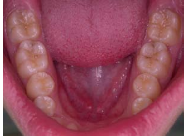
Figura 1- Aspecto inicial, evidenciando uma lesão de cárie restrita ao sulco méseo-distal do elemento 46 (vista oclusal).

fluoretada. O exame clínico demonstrou a ausência de manchas brancas nas superfícies livres dos dentes (Figura 1). As únicas manifestações da presença da cárie foram diagnosticadas nas superfícies oclusais dos elementos 46, 47 e 36.