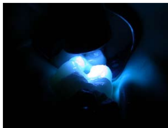
Figura 10 – Foto-ativação.