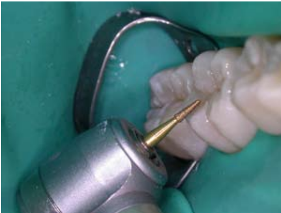
Figura 12- Acabamento da restauração.

sido perdida no preparo cavitário. Após o acabamento inicial, o isolamento foi removido e foi feita a análise da oclusão. Com o auxílio de fitas de demarcação oclusal AccuFilm (Parkell), a paciente foi manipulada para ocluir em relação cêntrica. Não foi constatada nenhuma interferência. Da mesma forma, quando a paciente ocluiu em máxima intercuspidação habitual, também não foi encontrada nenhuma interferência.