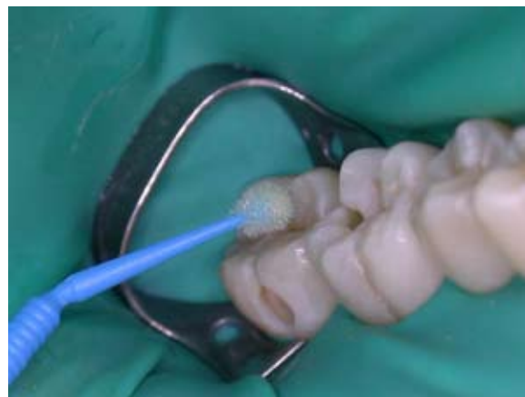
Figura 9- Aplicação do sistema adesivo - Single Bond/3M - em camadas intercaladas por suaves jatos de ar (vista direta por mesio-vestibular).

Foi executado o condicionamento ácido total da cavidade, com ácido fosfórico a 37% (Attack-Tec, Dental-Tec) por 15 segundos. Após esta etapa, foi possível observar o aspecto de perda de brilho do esmalte próximo das margens da cavidade. Foi aplicado o sistema adesivo (Single Bond/3M ESPE) em camadas, intercaladas por suaves jatos de ar (Figura 9). Após verificar o aspecto brilhoso da dentina e do esmalte cobertos pelo adesivo, procedeu-se a foto-ativação (Figura 10). A inserção da resina composta (Z250/3M-ESPE) cor A1 foi executada em incrementos, tomando o cuidado de não unir paredes circundantes opostas da cavidade (Figura 11). Cada incremento foi foto-ativado por 40 segundos. Os incrementos foram inseridos da forma mais anatômica possível, para minimizar a etapa de acabamento.