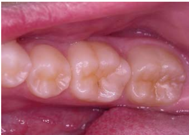
Figura 13 - Aspecto final.

Com o polimento final, deu-se por concluído o procedimento restaurador (Figura. 13).