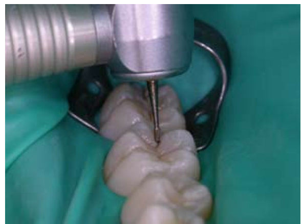
Figura 6 – Abordagem inicial da lesão cariosa do dente 46 com broca carbide nº 329 em alta-rotação (vista direta por mesial).

Com o dente isolado, foi feita a abordagem inicial da lesão cariosa do dente 46. Foi utilizada a broca carbide nº 329 em alta-rotação (Figura 6). Ao remover o esmalte intacto da superfície oclusal o operador experimentou a sensação de “cair no vazio”, que acontece quando a pressão exercida na ponta de alta-rotação, suficiente para cortar o esmalte dentário, torna-se excessiva para cortar tecidos cariados, que são menos resistentes que os tecidos hígidos. Ao atingir o corpo da lesão de cárie o operador iniciou a remoção da dentina cariada do elemento 46 com broca de aço nº 2 em baixa-rotação (Figura 7).