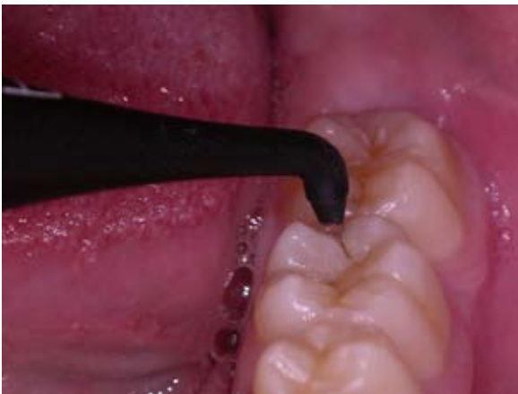
Figura 5- Ponta do Diagnodent (Kavo), aplicado no dente 36, após a aplicação nos dentes 46 e 47, com o objetivo de comparar as lesões de cárie existentes (vista direta por mesial).

Com o diagnóstico estabelecido: cavitação provocada por cárie nos elementos 36 e 47, e cárie oculta no elemento 46; o plano de tratamento proposto foi: orientação de higiene bucal, controle da dieta cariogênica, orientação sobre o uso do flúor e tratamento restaurador dos elementos 46, 36 e 47. Como o objetivo deste trabalho é relatar um caso clínico de diagnóstico e tratamento de cárie oculta, a descrição a seguir referir-se-á somente ao elemento dental nº. 46. O material restaurador proposto foi resina composta, por tratar-se de uma lesão pequena, sem envolvimento de cúspides.