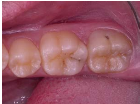
Figura 2- Aspecto inicial, em maior aproximação.

No dente 46 havia uma lesão de cárie restrita ao sulco méseo-distal, sem cavitação. As margens da lesão não se apresentavam esbranquiçadas, sugerindo o diagnóstico de lesão de cárie paralisada 15 .