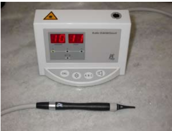
Figura 4 – Diagnodent (Kavo), instrumento utilizado como método auxiliar de diagnóstico.