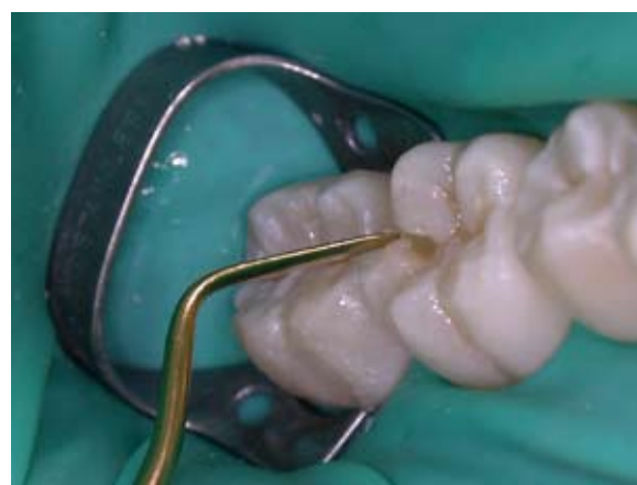
Figura 11 - Inserção da resina composta - Z250/3M/ESPE - no elemento 46 (vista direta por mesial).

O acabamento da restauração foi executado na mesma sessão (Figura 12). Foram utilizadas pontas diamantadas de granulação fina nº. 3118 e 1190 (KG Sorensen/SS White). As pontas diamantadas desgastaram a restauração sutilmente, para reproduzir a anatomia da superfície oclusal que havia