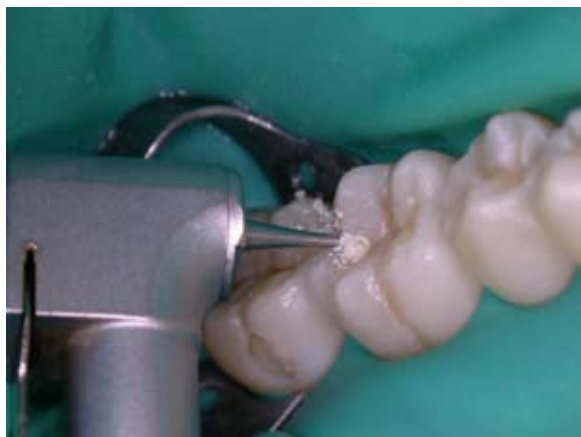
Figura 7- Remoção de dentina cariada do elemento 46 com broca de aço nº 2 em baixa-rotação (vista direta por mesio-vestibular).

O preparo cavitário foi finalizado quando foi constatado que não havia mais dentina contaminada. No fundo da cavidade foi mantida a camada de dentina esclerosada, que tem maior resistência ao corte com brocas, e a importante função de proteger o complexo dentina-polpa contra agressões externas 16 (Figura 8).