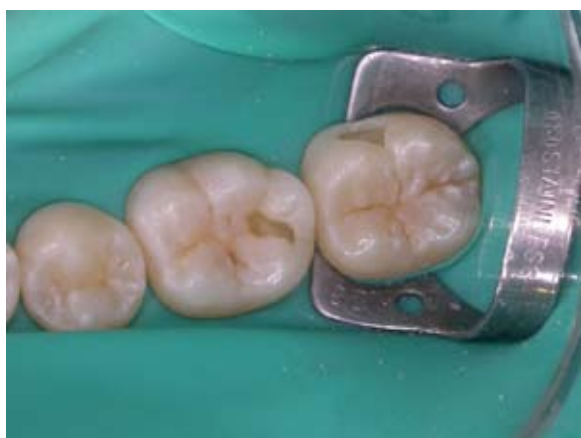
Figura 8- Aspecto da cavidade após o preparo (vista oclusal).

O preparo cavitário foi finalizado quando foi constatado que não havia mais dentina contaminada. No fundo da cavidade foi mantida a camada de dentina esclerosada, que tem maior resistência ao corte com brocas, e a importante função de proteger o complexo dentina-polpa contra agressões externas 16 (Figura 8).